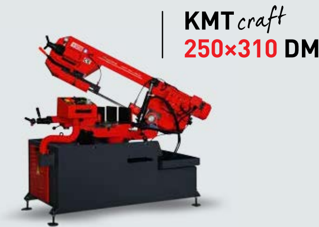
KMTcraft 250x310 DM