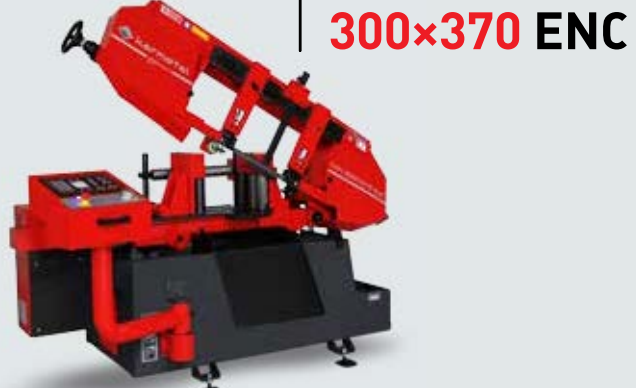
OSA 300x370 ENC