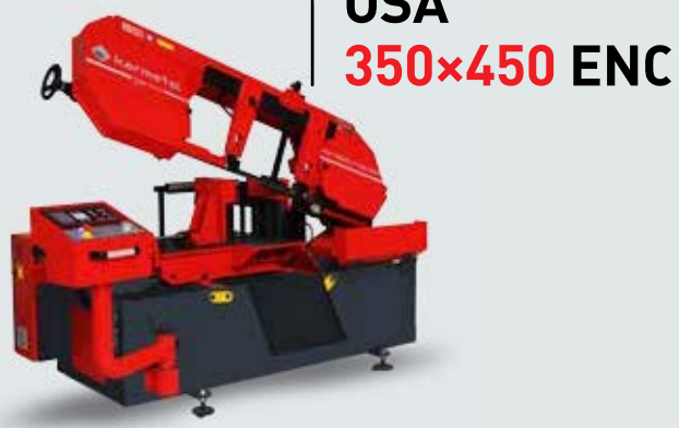
OSA 350x450 ENC