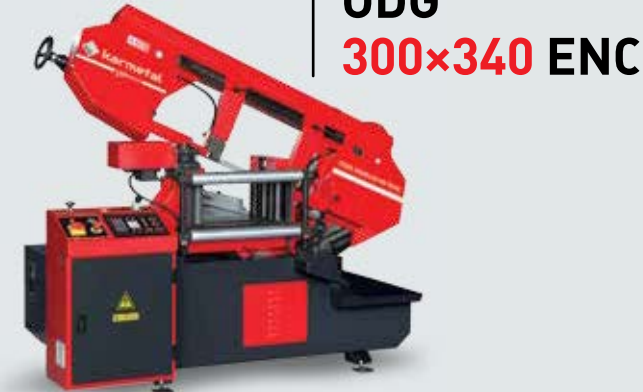
ODG 300x340 ENC