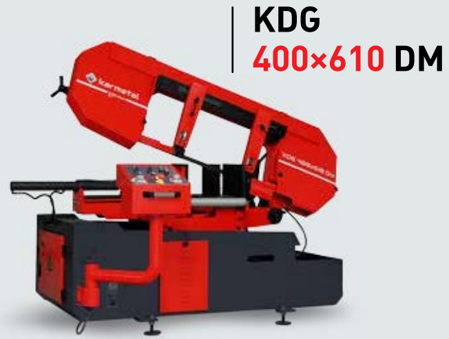
KDG 400x610 DM