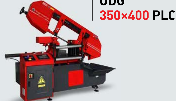
ODG 350x400 PLC