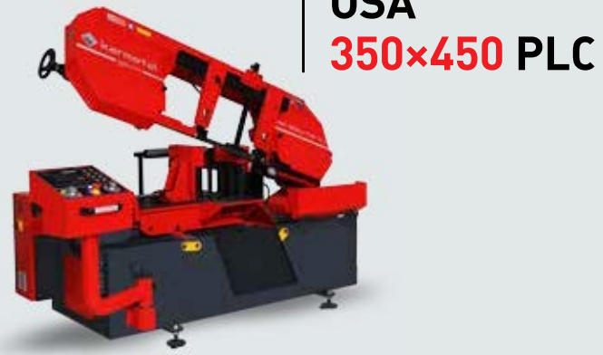
OSA 350x450 PLC