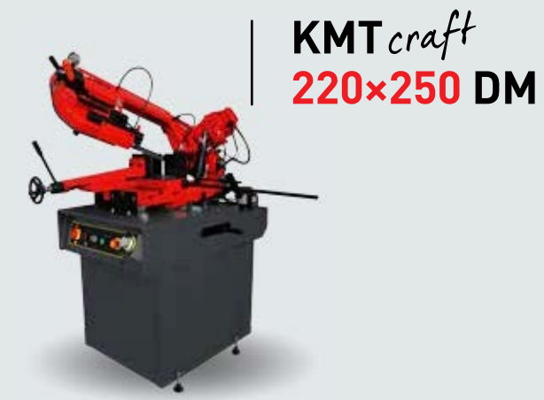
KMTcraft 220x250 DM