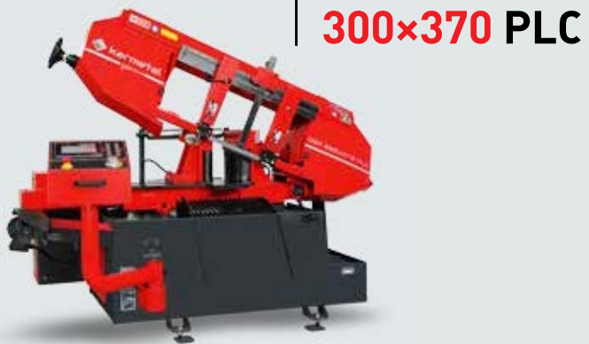
OSA 300x370 PLC