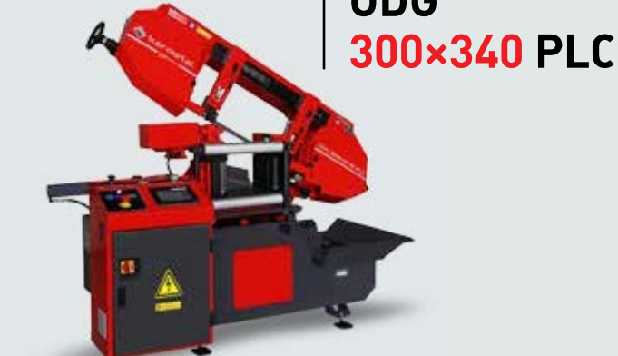
ODG 300x340 PLC