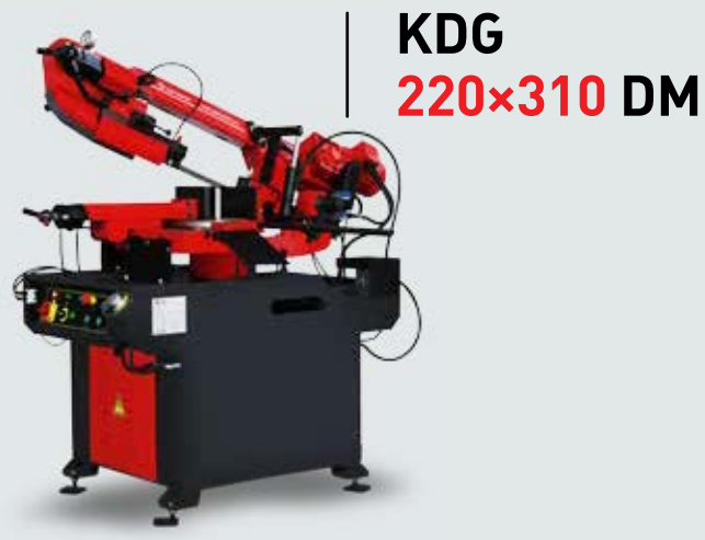
KDG 220x310 DM