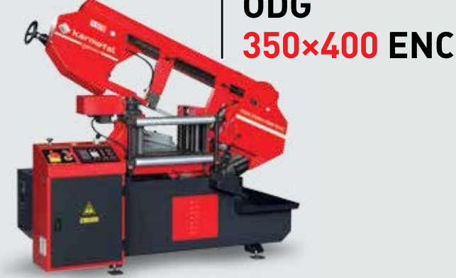
ODG 350x400 ENC